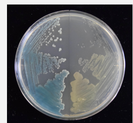
図2 淡水環境から採取されたビブリオのコロニー

本研究は、淡水環境におけるビブリオの発生状況を調査し、水環境で起きている変化の予測・評価に応用することを目指しています。