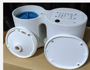
本研究において使用している噴霧器の写真

噴霧粒子径が数10~数100nmであるミストを噴霧する機器の開発とその応用に取り組んでいる。この噴霧器はベンチュリー効果と特殊な分離板を用いた構造となっており, 粒子径のばらつきが小さいミストを噴霧する機器であり, さらに, この粒子径を制御することができる。現在は, この噴霧器を用いて農業を自動で, かつ, 均一に噴霧する方法についてフィールド実験に取り組んでいる。今後は, 医療やヘルスケア等の分野へ展開する予定である。